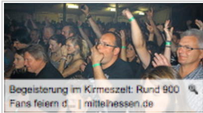
Begeisterung im Kirmeszeit: Rund 900 Fans feiern d... | mittelhessen.de

Breidenbach (val). Einen solchen Einstieg in ihr Kirmeswochenende haben die Breidenbacher Burschen noch nie erlebt: Feuerbälle steigen gen Himmel, Blitze zucken durch das Festzelt, und wabernde Rauchschwaden hüllen jubelnde Fans ein. Das ist das Werk der Rocker von "Völkerball", die ihren musikalischen Vorbildern von "Rammstein" in nichts nachsteht.